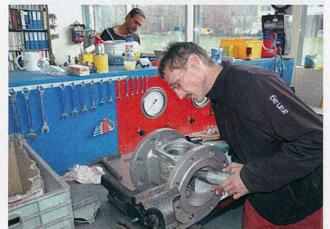
In vielen Fällen lohnt sich eine Instandstellung. Dabei werden Ressourcen und nicht zuletzt Geldmittel geschont.