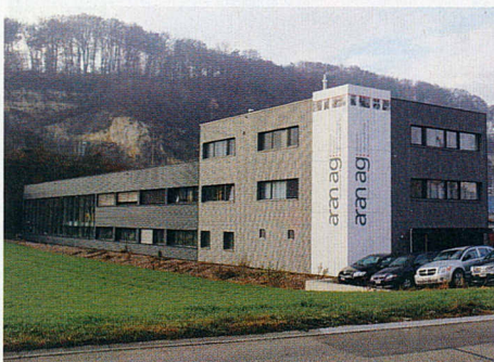
Das neu erstellte Firmengebäude der aran ag in Lausen mit Bürotrakt, Werkstatt und Lager.

Kanalstrasse 11 • 4415 Lausen Tel. 061 927 44 44 info@aran.ch • www.aran.ch